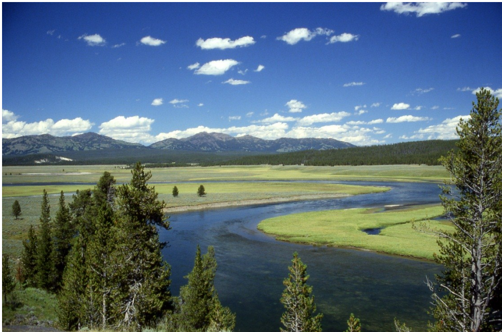
Fig. I - Valle di Hayden (Parco dello Yellowstone) Foto di Héctor Ceballos Lascurain.

É in questo contesto di crescita ed evoluzione, di sconvolgimenti e distruzioni, che nasce l'esigenza di preservare alcune aree del paesaggio di particolare interesse, come sarà anche scritto all'ingresso del Parco dello Yellowstone: "For the benefit and enjoyment of future generation", (A beneficio e godimento delle generazioni í future). L'istituzione del Parco dello Yellowstone, il 1 marzo del 1872, fu il primo esempio al mondo di protezione della natura selvaggia.